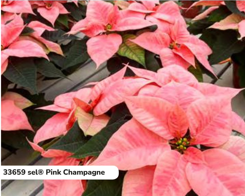
33659 sel® Pink Champagne