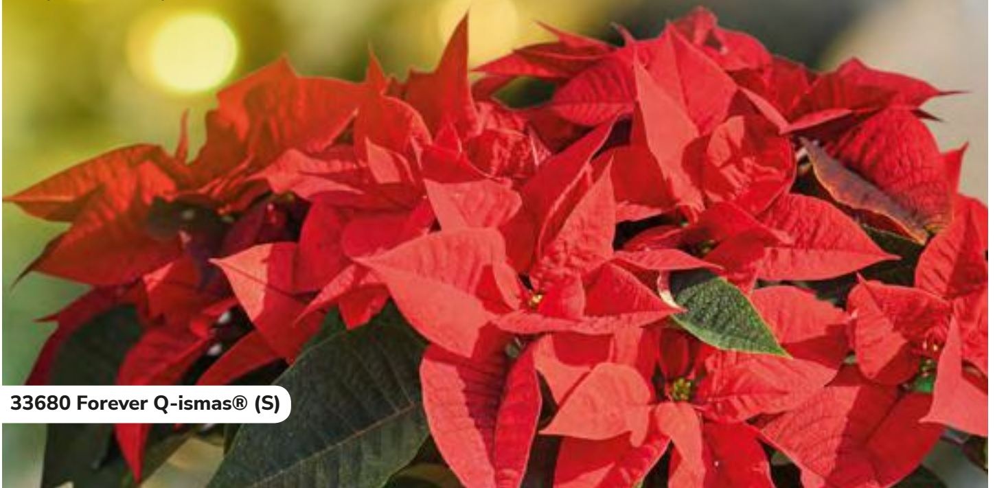
33680 Forever Q-ismas® (S)