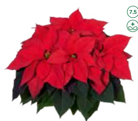
33634 sel® Holy Day (S)