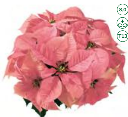
33565 sel® Christmas Feelings Pink (S)