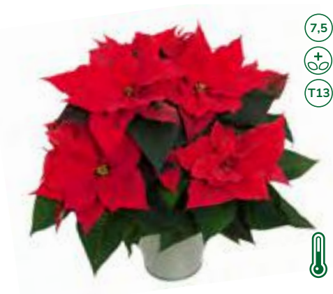
33588 sel® Christmas Universe (S)