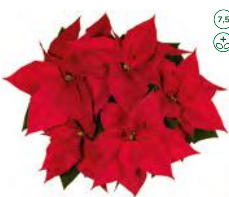
33466 sel® Noel (S)