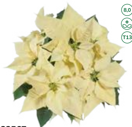
33567 sel® Christmas Feelings White (S)