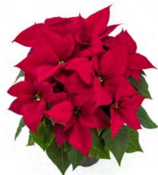
33608 Leona Red (S)