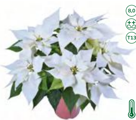
33446 Alpina, Lazzpo1315 (S)