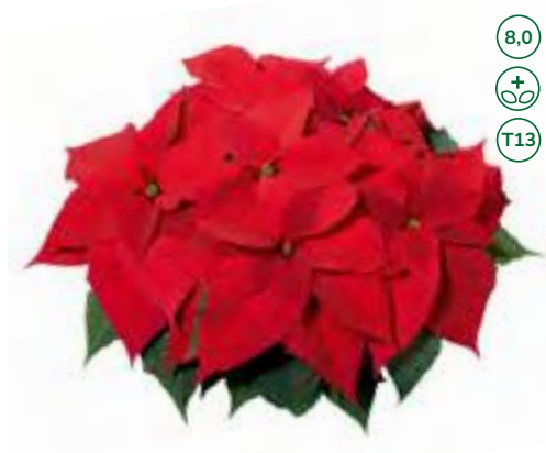
33561 sel® Christmas Feelings Red (S)

The sel® Christmas Feelings* varieties branch excellently and are characterised by transport stability and durability. They are top sellers throughout Europe.